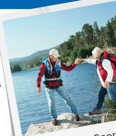
Freizeit & Sport

Aus diesen Gründen muss ein Hörsystem optimal an Ihre persönlichen Bedürfnisse angepasst werden. Nur so kann es seine volle Leistung erbringen – und Ihnen zu einem Höchstmass an Lebensqualität verhelfen.