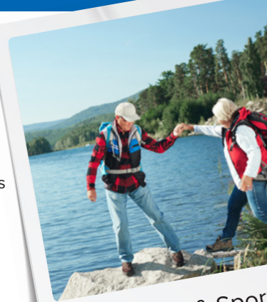
Freizeit & Sport

Aus diesen Gründen muss ein Hörsystem optimal an Ihre persönlichen Bedürfnisse angepasst werden. Nur so kann es seine volle Leistung erbringen – und Ihnen zu einem Höchstmass an Lebensqualität verhelfen.