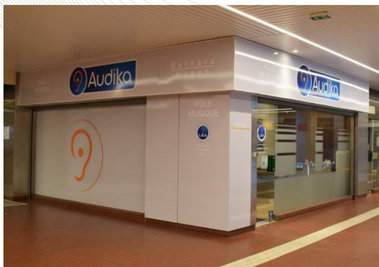
Le Pôle Musique AUDIKA

C'est pour répondre aux besoins spécifiques des mélomanes et des musiciens souffrant de troubles auditifs, que Audika s'est entouré des meilleurs spécialistes (ingénieur acousticien et audioprothésiste) pour concevoir la Cabine Musique 8.1, un outil idéal et unique au monde permettant l'élaboration d'un Programme Musique pour les patients musiciens ou mélomanes déficients auditifs.