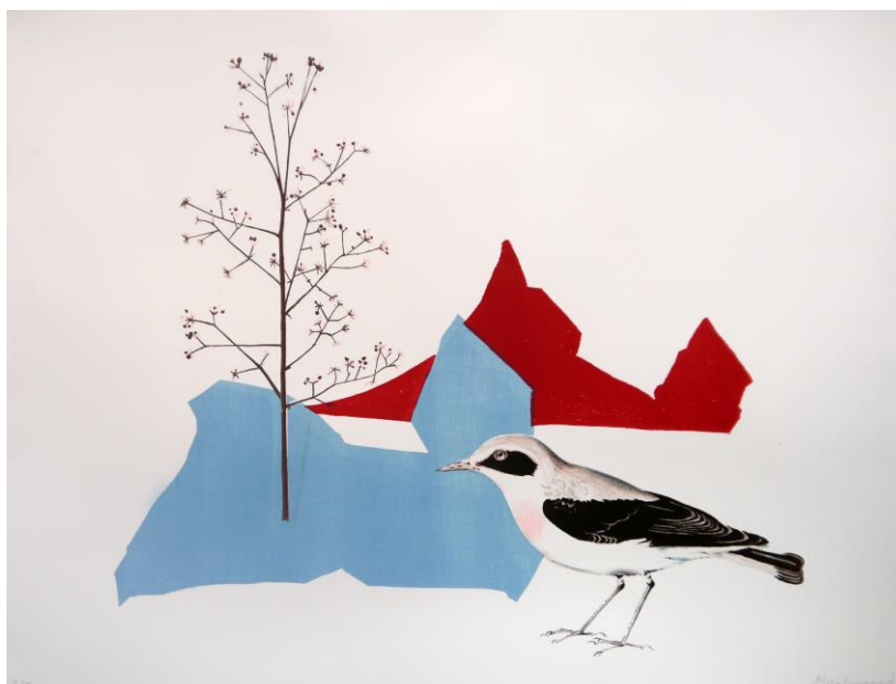
« Le chant du silence » de Blaise Drummond

C'est l'artiste irlandais BLAISE DRUMMOND qui rejoint cette année la Galerie de l'Audition en proposant une œuvre originale qu'il a intitulée « Le Chant du Silence ».