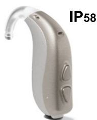
Model P BTE z zaprojektowaną przez Bernafon "esowatą" obudową

Generując maksymalne poziomy wyjściowe (MPO) osiągające nawet 138 dB SPL, modele P BTE są idealne dla Klientów ze średnio-dużymi i dużymi ubytkami słuchu rzędu 100 dB HL.