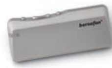
Дистанционное управление RC-P