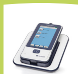
easyScreen-Gerät mit Ladestation

Im Interesse des technischen Fortschritts behalten wir uns Änderungen vor. Protokolle können nur mittels HearSIM™ PC-Software geändert werden.