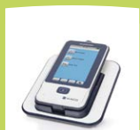
easyScreen-Gerät mit Ladestation

Im Interesse des technischen Fortschritts behalten wir uns Änderungen vor. Protokolle können nur mittels HearSIM™ PC-Software geändert werden.