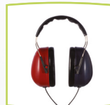
Kopfhörer DD65 v2