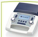
MA 28 Gerät