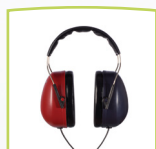
Kopfhörer DD65 v2