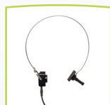
Knochenleitungs- hörer B71