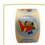
Rolle mit Stickern