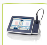
touchTympanometer Gerät mit Drucker