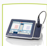
touchTymp Gerät mit Drucker