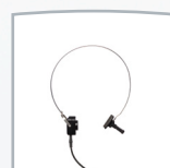
Knochenleitungs- hörer B71