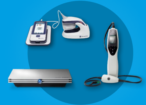
PEA - OEA ASSR VEMP