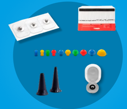
Consommable compatible toutes marques