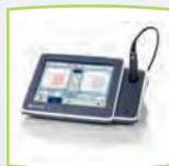
touchTymp con stampante