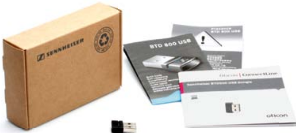
Sennheiser BTD800 USB-sovitin