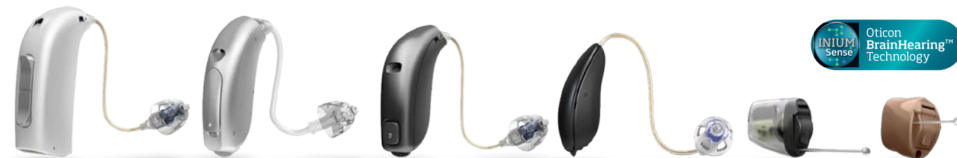
Représentation à l'échelle des aides auditives. Disponibles dans d'autres coloris.