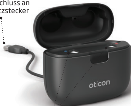
Ladeanschlüsse Zum Laden von Hörsystemen

USB-Kabel Für Anschluss an den Netzstecker