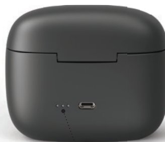
LED-Anzeige für den Akkustatus Zeigt den Lade-/Akkustatus der Powerbank

*Der Netzstecker ist von Land zu Land unterschiedlich.