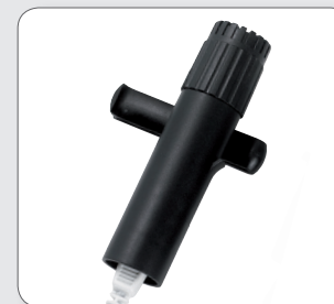
Externes Handmikro als Zubehör erhältlich

Mit Sumo DM ist ein externes Mikrofon auf dem Markt. Das MIC 32 bietet zusätzliche Möglichkeiten in schwierigen Hörsituationen.