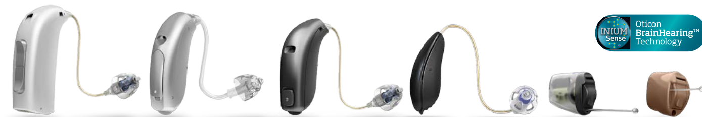
Werkelijke grootte van de hoortoestellen. Verkrijgbaar in verschillende kleuren.