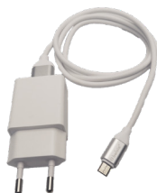
Strømforsyning (5V micro usb)