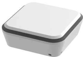
Observer Pro babyalarm