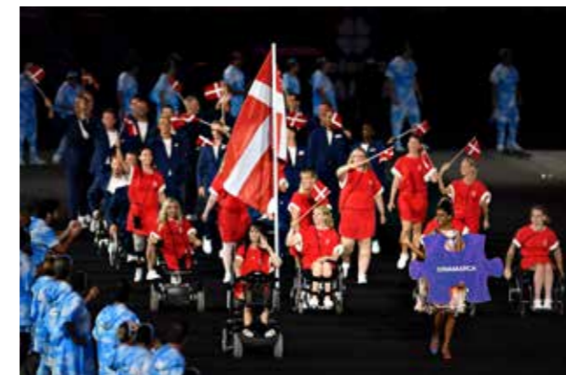
Den danske indmarch ved PL i Rio 2016

I forbindelse med Tokyo i 2020 er målet - sammen med Parasport Danmark - at få både en række erfarne atleter