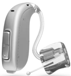
Taille réelle BTE Plus Power 105

Permettre à vos clients dont la perte auditive évolue, de continuer à utiliser les mêmes technologies de traitement de signal qui ont fait le succès de leur appareillage jusqu'à présent, tout en leur proposant plus de puissance et une discrétion équivalente , est la garantie d'un nouvel appareillage plus rapidement accepté et satisfaisant.