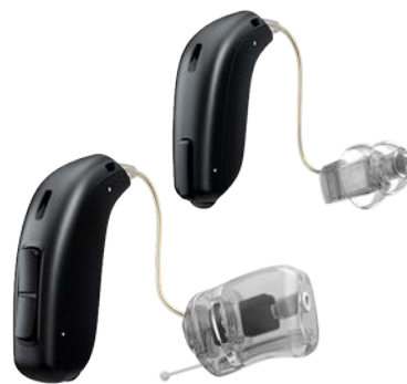
■ Embouts, dômes à évent et dômes Power