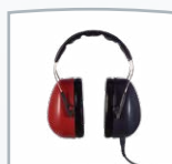
LL-Kopfhörer DD65 v2