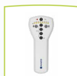
MA 1 Gerät