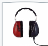
LL-Kopfhörer DD65 v2