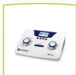
MA 25 Gerät