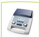
MA 27 Gerät