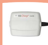
MB 11 Box