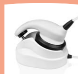
MB 11 BERAprhone mit Hörerablage